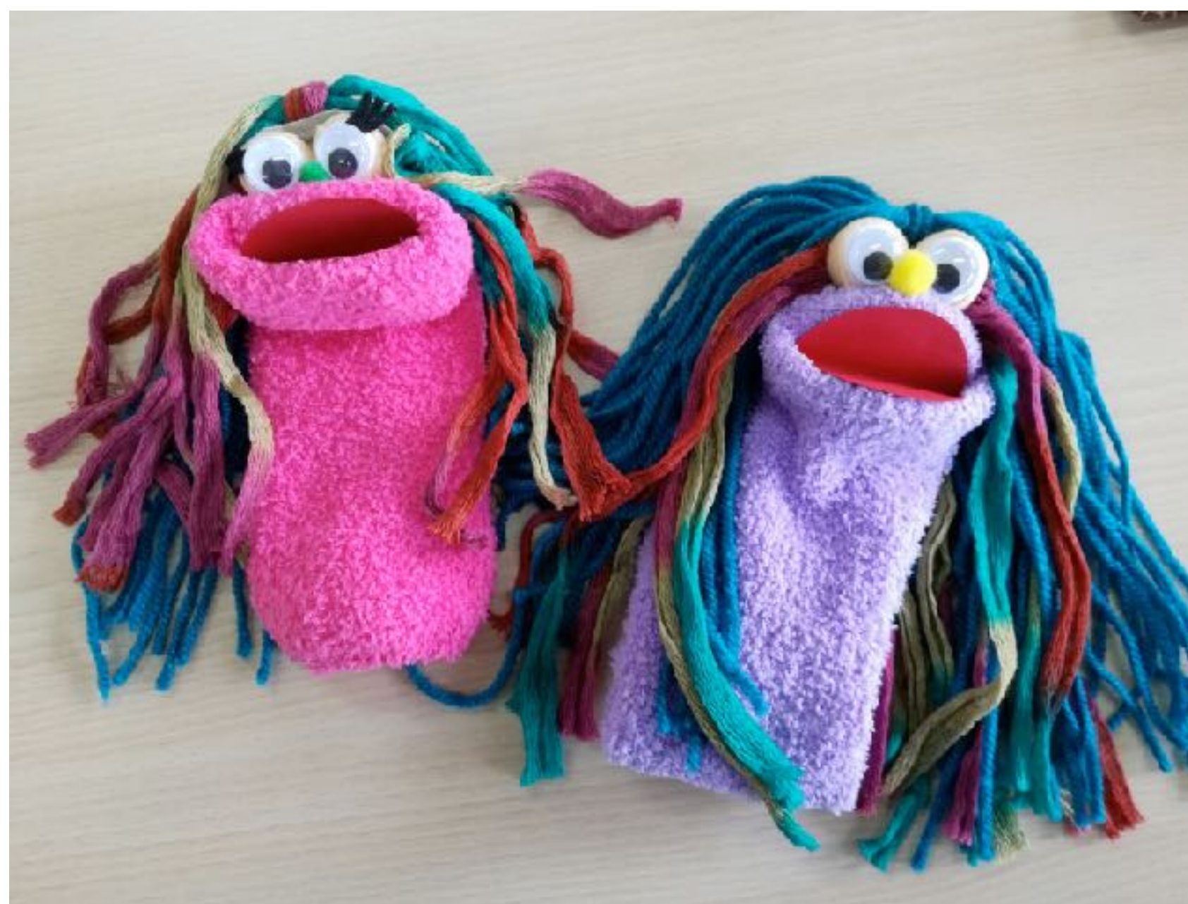
Ursulina la más divina